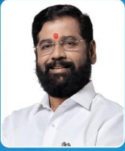
श्री. एकनाथ शिंदे (मा. उपमुख्यमंत्री)