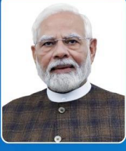
श्री. नरेंद्र दामोदरदास मोदी (मा. पंतप्रधान)