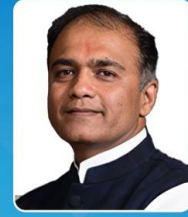
डॉ. पंकज कांचन राजेश भोयर (मा. राज्यमंत्री - गृहनिर्माण)