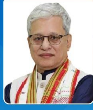
श्री. जिष्णू देव वर्मा (मा. राज्यपाल)