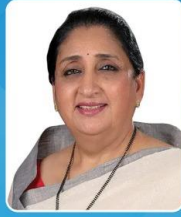
सौ. सुनेत्रा अजित पवार (मा. उपमुख्यमंत्री)