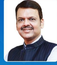
श्री. देवेंद्र फडणवीस (मा. मुख्यमंत्री)